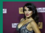
A 87. Oscar-gála